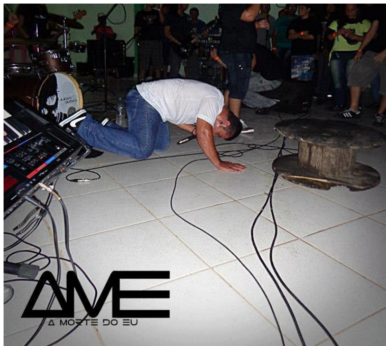
Fotografia 11.