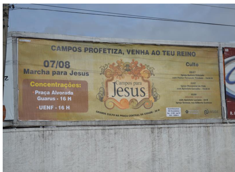
Fotografia 3. 17

São Salvador. Ainda na lateral direita e mais um pouco embaixo em branco, o nome do banco federal para depósito das contribuições .