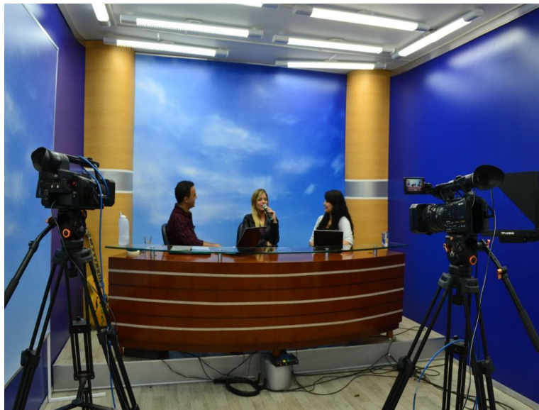
Fotografia 10.

profissionais como mestranda do Programa de Pós Graduação da UENF que realizava pesquisa sobre música gospel .