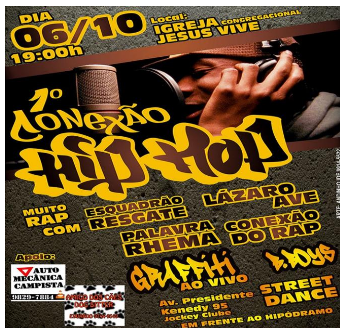
Fotografia 5.

O evento “Conexão Jovem” é realizado por um grupo de jovens e ocorre uma vez por mês. A cada mês é escolhido um ritmo diferente para tocar na igreja. No mês de outubro, o ritmo escolhido foi o Hip Hop . Segundo a líder do grupo jovem: