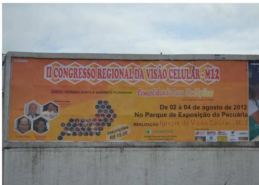
Fotografia 8.