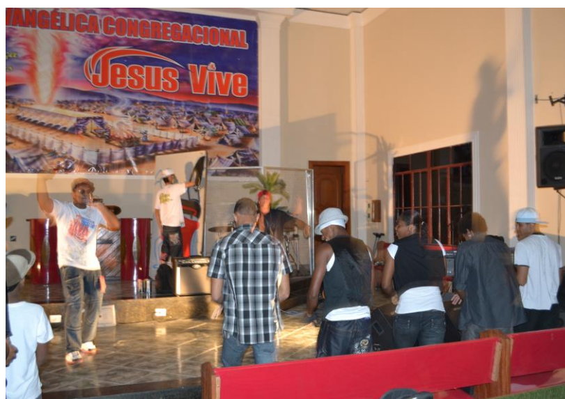
Fotografia 7.

exercem dinâmicas de movimento nele através do uso, e assim o potencializam e o atualizam. Para tanto, isso é percebido ao observar os jovens que estão no local na fotografia a seguir. A igreja é ocupada pelos jovens, e eles estão vivenciando o evento, dançando, cantando e se apresentando. Ainda para Certeau (1996) quando ocupado, o lugar é imediatamente ativado e transformado, passando à condição de lugar praticado. Com isso, ao olhar e observar todos os ângulos da fotografia vê-se que diferentes lugares da igreja, como o altar, palco e os bancos estão sendo utilizados. Os presentes pintam, cantam e dançam e, assim, transformam em lugar em algo diferente do planejamento do lugar.