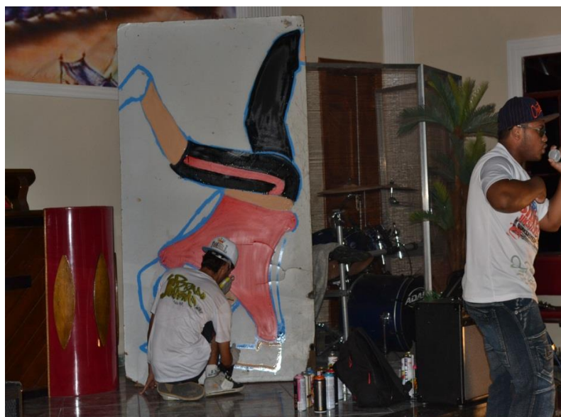
Fotografia 6.

A fotografia 6 destaca o momento em que o jovem grafita um desenho no altar da igreja enquanto cantores se apresentam. Esse grafiteiro começou a grafitar no início do evento e, durante os intervalos de cada banda, a atenção voltava-se para a grafiteagem. No final, ele deu um depoimento explicando a escolha do desenho.