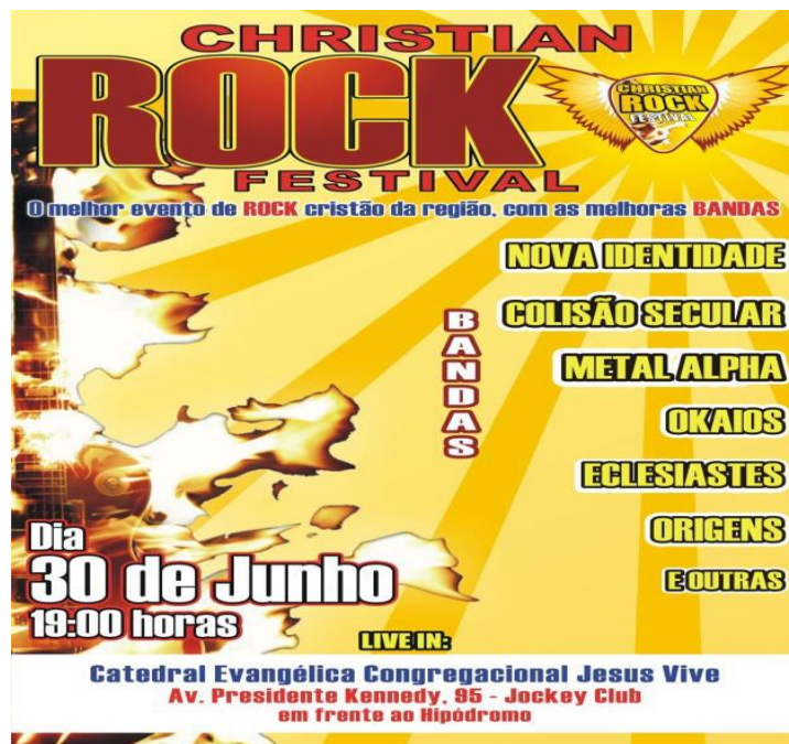
Figura 1.

Segundo Ulpiano de Meneses (2003), é necessário que haja propostas cautelares para o uso indiscriminado de imagens. Examinando as contribuições da História da Arte, da Antropologia Visual, da Sociologia Visual e dos Estudos da Cultura Visual para os estudos dos registros visuais, o autor tece uma crítica ao uso que os historiadores fazem da imagem como fontes de pesquisa. Ratificando que os estudos das fontes visuais na História ainda estão em desenvolvimento, aponta algumas premissas para a consolidação de uma História Visual, propondo um deslocamento de atenção por parte dos historiadores.