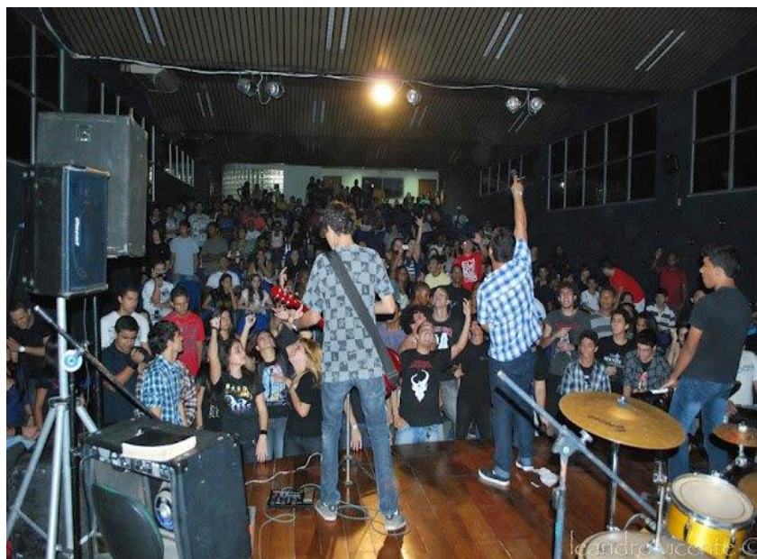
Fotografia 2. Fonte: Leandro Vicente 10 .

A imagem de um bíblia se encontra em cima de uma das caixas de som. Durante o show da banda, em vários momentos o vocalista segurava a bíblia em suas mãos e cantava. No intervalo de suas músicas, lia uma palavra da bíblia. No momento em que era escolhida a palavra, os jovens que estavam assistindo abriam suas bíblias e o acompanhavam na leitura.