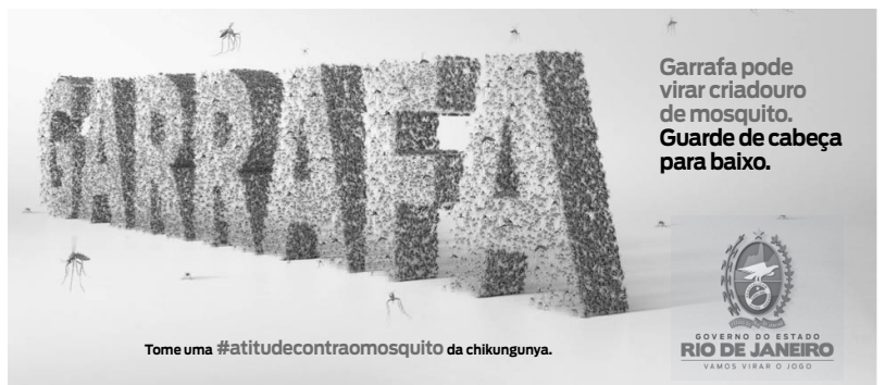
Tome uma #atitudecontrao mosquito da chikungunya.

Garrafa pode virar criadouro de mosquito. Garde de cabeça para baixo.