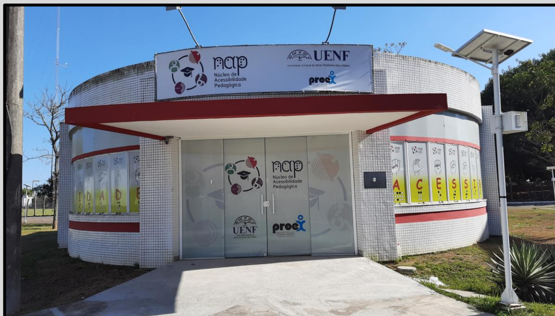
Imagem da fachada frontal do NAP/UENF. O prédio é redondo, de pavimento único, na cor branca e com faixas vermelhas em volta das janelas e na marquise de entrada. Na porta de vidro e acima da marquise há logotipos do NAP/UENF, da UENF e da PROEX. Nas janelas há adesivos coloridos que formam a palavra acessibilidade, que está escrita em português, Braille e no alfabeto manual da língua de sinais. A esquerda da fachada há um poste de concreto, à direita há um poste branco de iluminação solar, e ao fundo há árvores