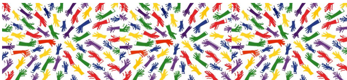
Desenho de mãos coloridas estendidas que simbolizam diversidade, integração e inclusão.

Transmitimos nesta publicação informação sobre o tema, mas empatia, proatividade e mudança de atitude ficarão sempre por conta de cada pessoa. Faça a sua parte!