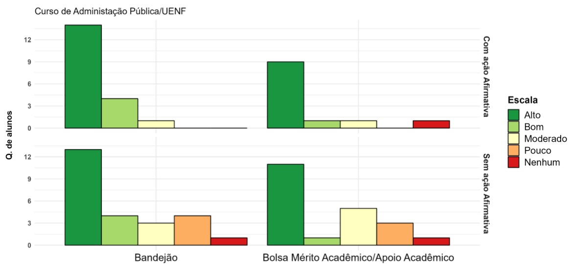
Gráfico 03: Respostas do Questionário.