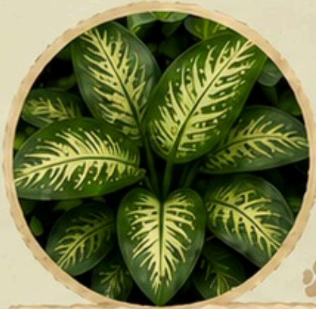
Comigo Ninguém Pode