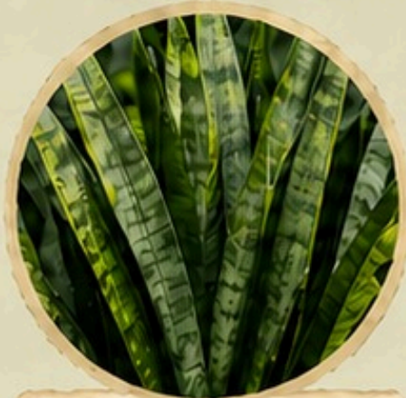
Espada São Jorge