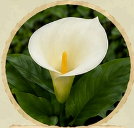
Copo de Leite