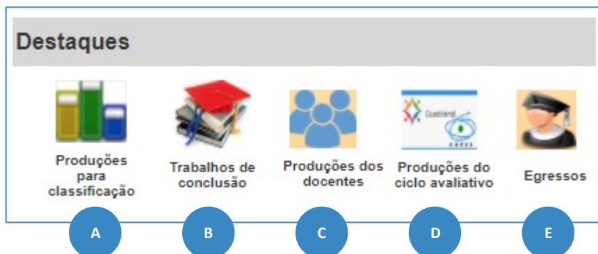
Figura 1. Módulo de Destaques na Plataforma Sucupira

2.3 A Plataforma Sucupira disponibilizará uma seção específica para destaques, conforme Figura 1.