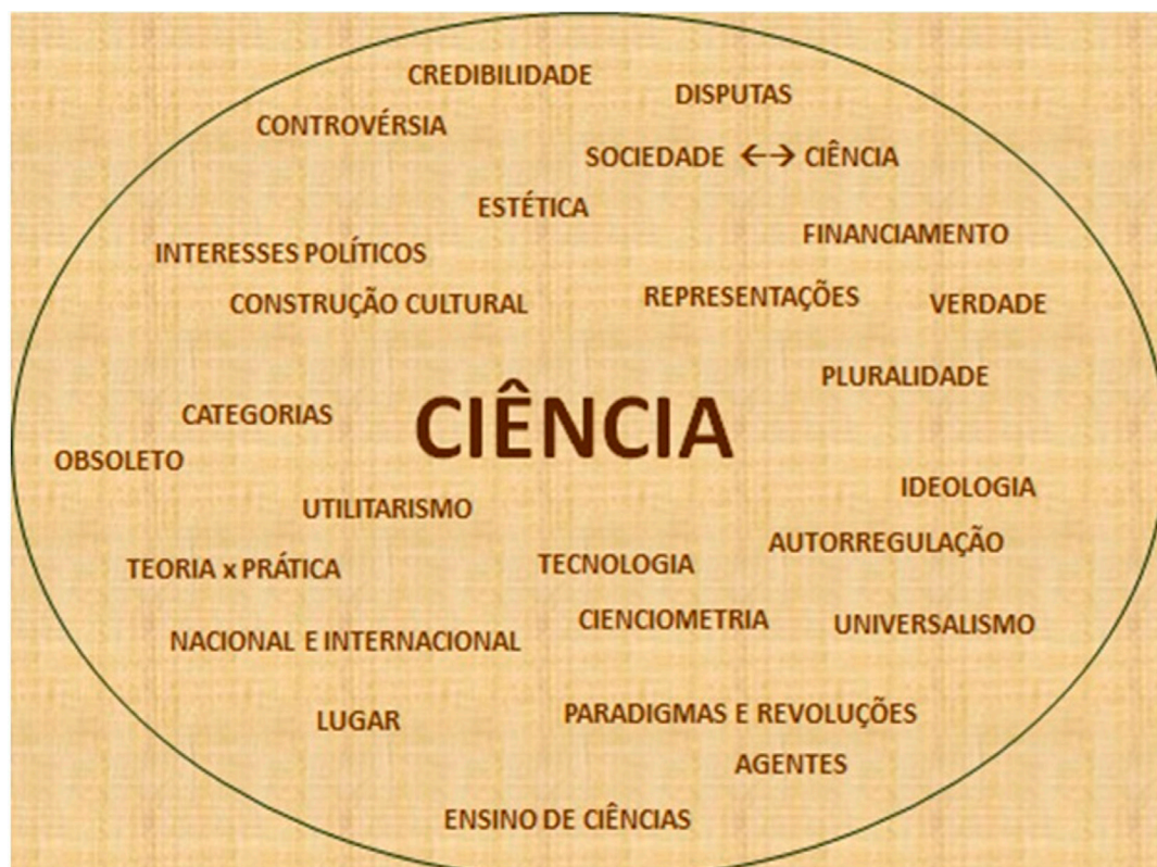
Figura 1- Panorama de concepção de ciência — versão inicial