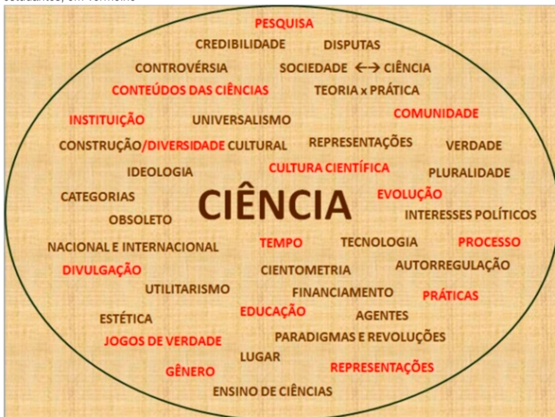
Figura 2- Panorama de concepção de ciência — segunda versão, contemplando contribuições dos estudantes, em vermelho