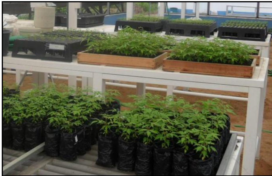
Figura 2 - Vista parcial do experimento conduzido em casa de vegetação de mudas de cedro australiano aos 90 dias após a sementeira. Campos dos Goytacazes, RJ.