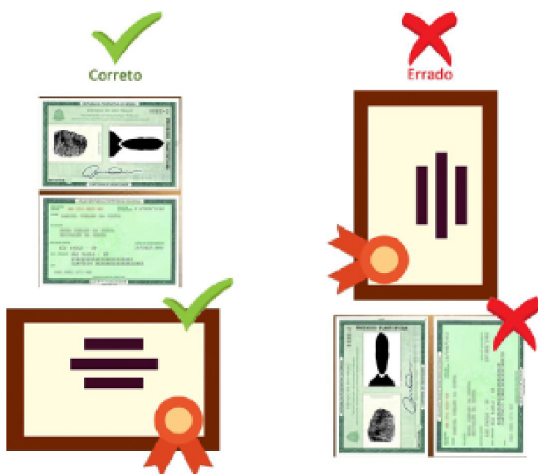
FIGURA 1: Instruções sobre a orientação dos documentos