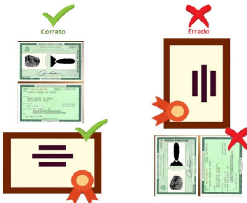
FIGURA 1: Instruções sobre a orientação dos documentos

8.2 O upload de todos os documentos deve estar em PDF; 8.3 O upload dos arquivos deve estar conforme figura 1 abaixo: