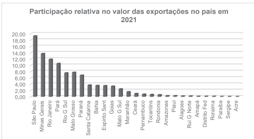
Figura 1 – Participação relativa dos estados