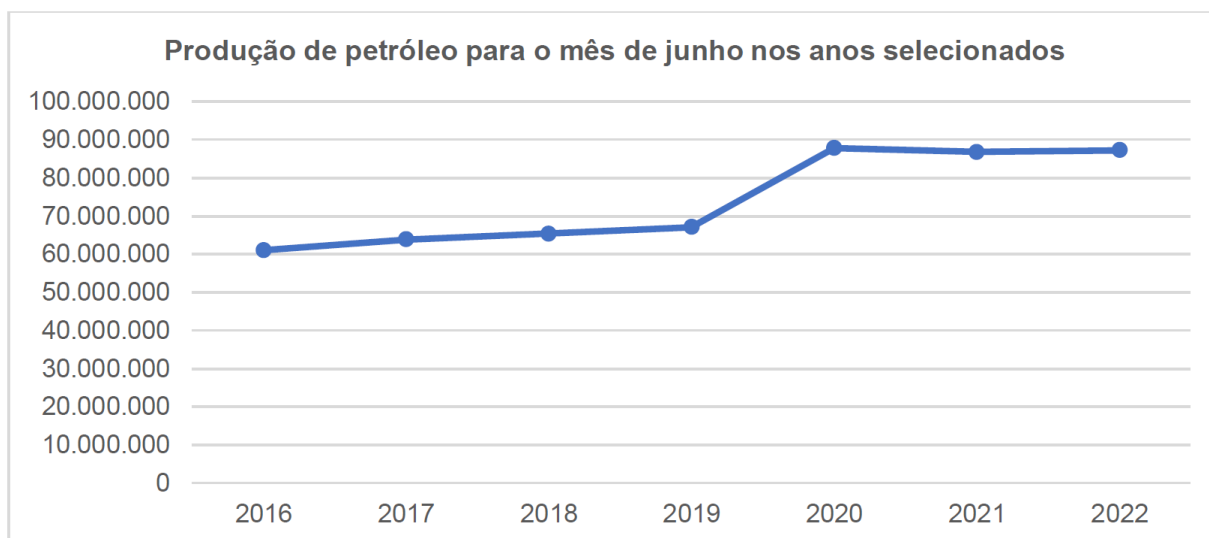
Figura 1: Produção de petróleo equivalente no mês de junho no estado do Rio (barris)

O estado do Rio de Janeiro produziu 87,2 milhões de barris de petróleo equivalente (boe) em junho de 2022, volume maior 1,63% em relação ao mês anterior e maior 0,46% em relação a produção do mesmo mês do ano anterior. A figura 1, a seguir, apresenta a evolução da produção em barris no estado para o mês de junho nos anos de 2016 a 2022.