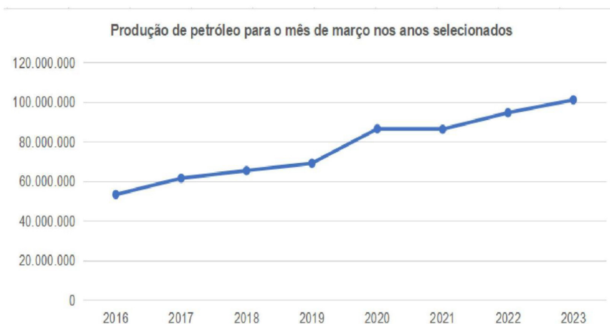
Figura 1: Produção de petróleo equivalente no mês de março no estado do Rio (barris)

O estado do Rio de Janeiro produziu 101,2 milhões de barris de petróleo equivalente (boe) em março de 2023, volume maior 4,0% em relação ao mês anterior e maior 6,9% em relação a produção do mesmo mês do ano anterior. A figura 1, a seguir, apresenta a evolução da produção em barris no estado para o mês de março nos anos de 2016 a 2023.