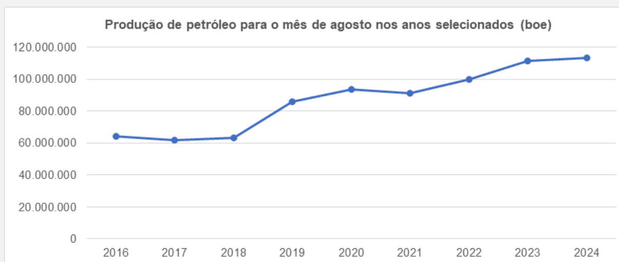
Figura 1: Produção de petróleo equivalente (boe) em agosto no Estado do RJ.

O estado do Rio de Janeiro produziu 113,1 milhões de barris de petróleo equivalente (boe) em agosto de 2024, volume maior 3,95% em relação ao mês anterior e menor 0,96% em relação à produção do mesmo mês do ano anterior. A figura 1, a seguir, apresenta a evolução da produção em barris no estado para o mês de agosto nos anos de 2016 a 2024.