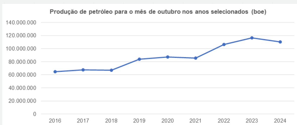
Figura 1: Produção de petróleo equivalente (boe) em outubro no Estado do RJ.

O estado do Rio de Janeiro produziu 110,2 milhões de barris de petróleo equivalente (boe) em outubro de 2024, volume menor 3,75% em relação ao mês anterior e menor 5,25% em relação à produção do mesmo mês do ano anterior. A figura 1, a seguir, apresenta a evolução da produção em barris no estado para o mês de outubro nos anos de 2016 a 2024.